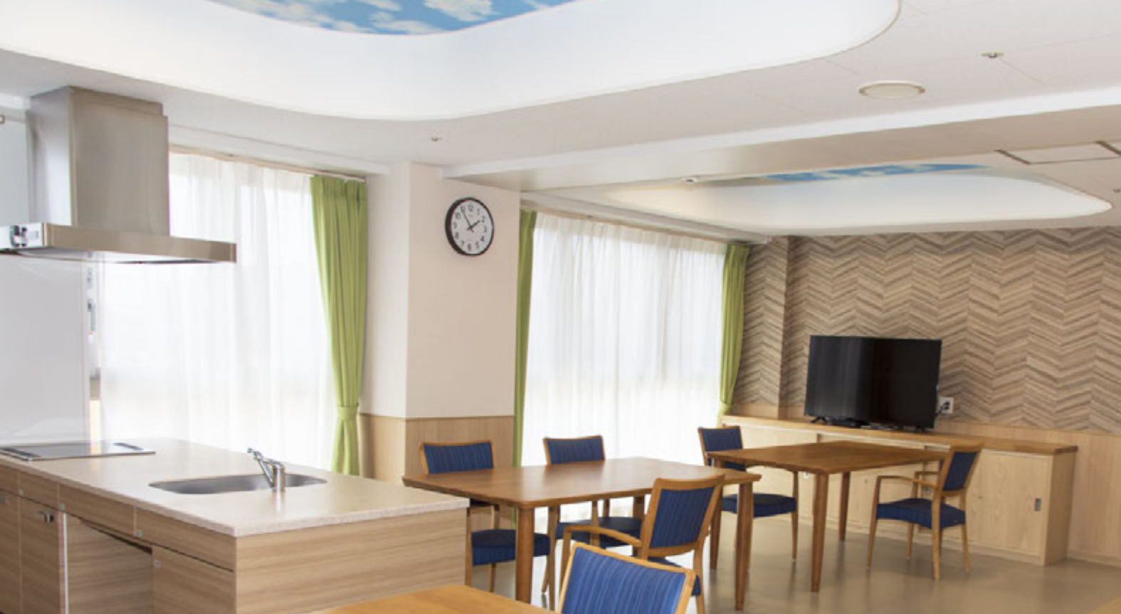
笑顔と温かい気遣いがあふれ、ゆったりとくつろげる共同生活室