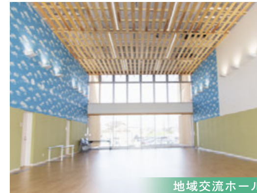
地域交流ホール 季節のイベントなど多彩なイベントがあり 地域の方々と楽しい時間を共有できます