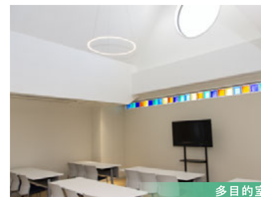
多目的室 職員の研修用、その他イベント 開催等にも使用できる多目的室