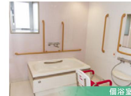
安心して入浴できる清潔な空間